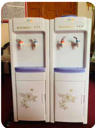
ウォーターサーバー