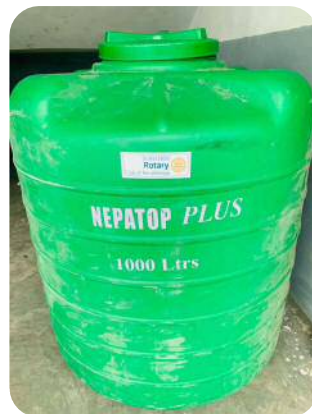
ウォータータンク