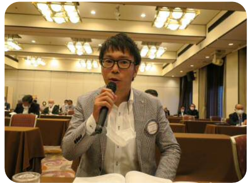
【城田委員長】 (会報・雑誌委員会)