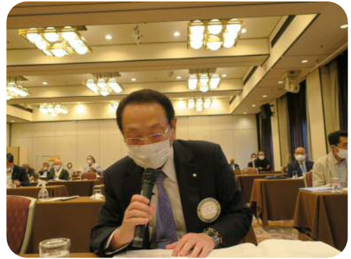
【川端委員長】 (ニコニコ委員会)