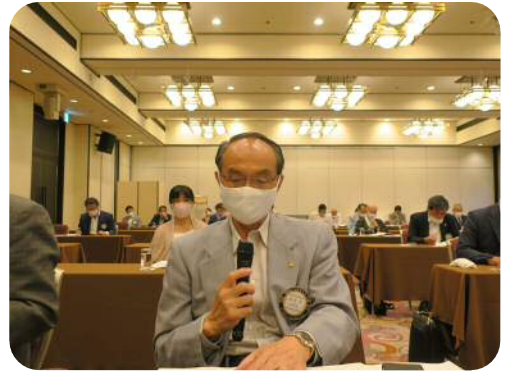
【多田委員長】 (クラブ広報常任委員会)