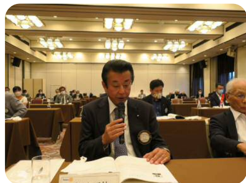
【宮西委員長】 (ロータリー情報委員会)