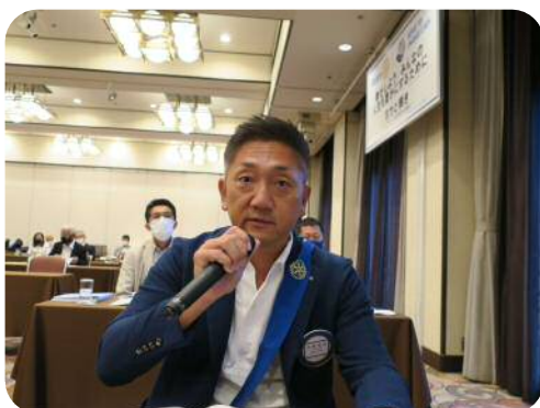
【河野委員長】 (親睦活動委員会)