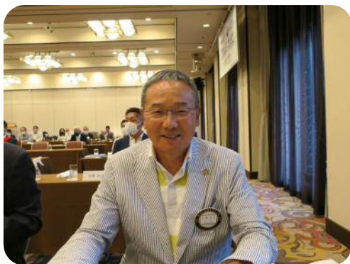
【中條実行委員長】 （IM実行委員会）