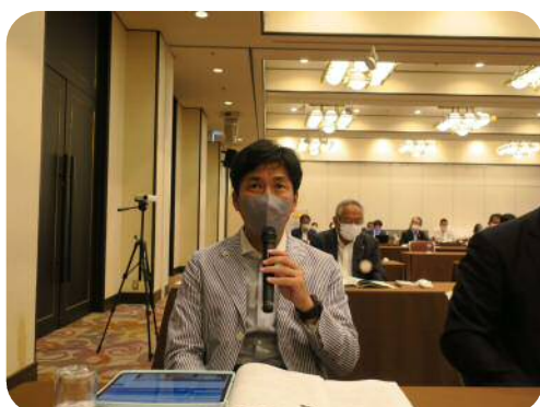
【清岡委員長】 (青少年奉仕委員会)