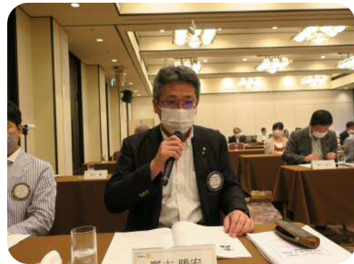
【野末委員長】 (職業奉仕委員会)