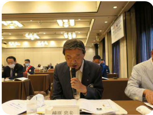
【楠原委員長】 (会員選考委員会)