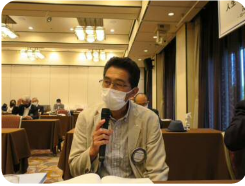
【宮坂委員長】 （出席委員会）