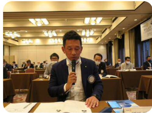
【國原委員長】 (会員増強委員会)