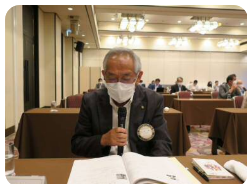
【佐川委員長】 (国際奉仕委員会)