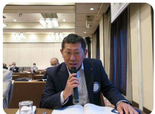
【山口委員長】 (プログラム委員会)