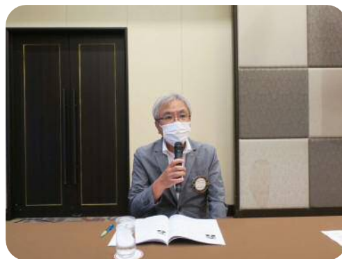
【谷川委員長】 （会員組織常任委員会）