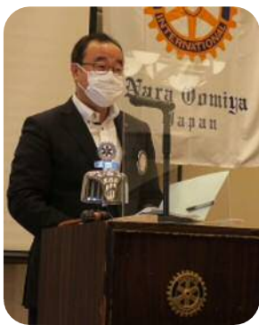
弓場会計（前期会費納入の件）

7月31日が前期会費納入期限となっております。万が一、まだの方はよろしくお願い申し上げます。 新入会員の方は状差しにかなり大切な情報が入っておりますので、ご確認頂き要領が分からなければいつでもお問い合わせください。