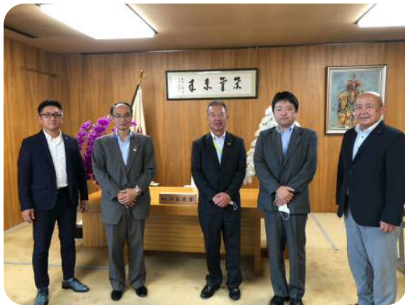
山本進章 議長（奈良県議会）