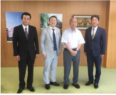
奈良県知事 荒井正吾 様