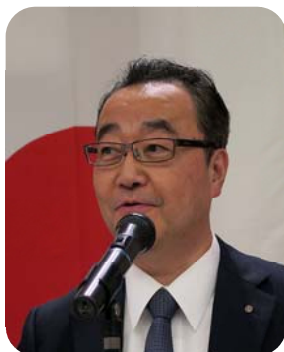
青少年奉仕委員会 弓場委員長