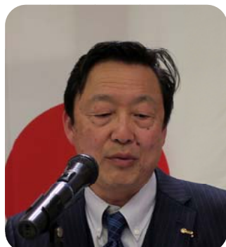
クラブ管理運営委員会 増井副会長